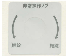
表示シール付 附表示贴纸