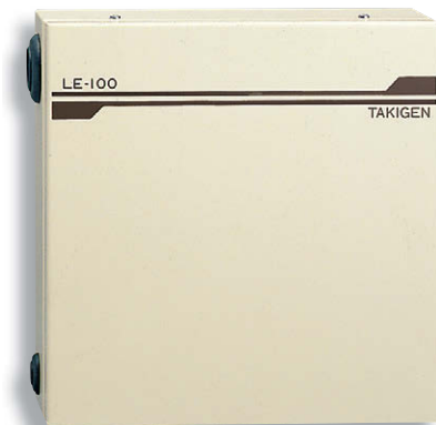
3連追加コントローラー 3联追加控制器