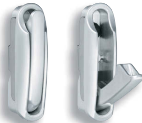
スーツフック 衣物钩