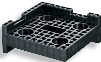
CP-660-A (フラットタイプ) (扁平型)