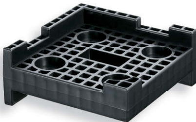
CP-660-B (爪付きタイプ) (带卡爪型)