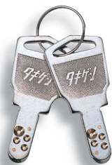
キーNo. D001 钥匙