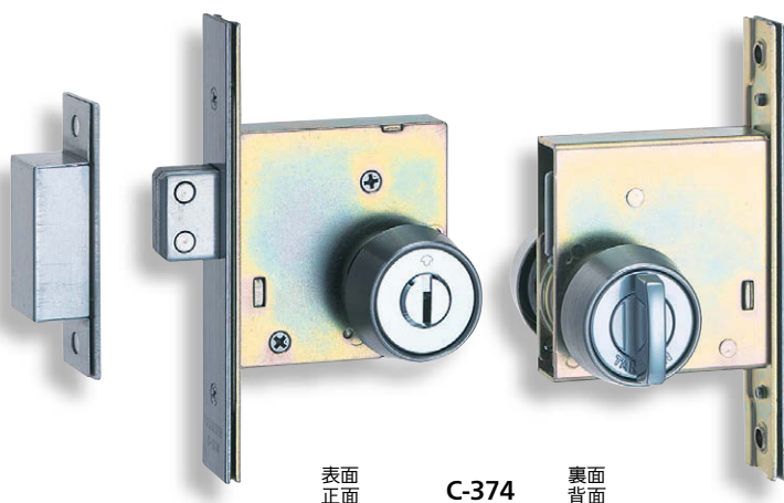
表面正面 C-374 裏面背面

※写真は錠前組込例です。本製品の錠前は別売です。 ※照片是与锁芯的组装例。锁芯为另售。