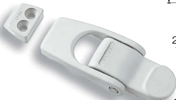
CP-38-2 鍵穴なし 无锁孔