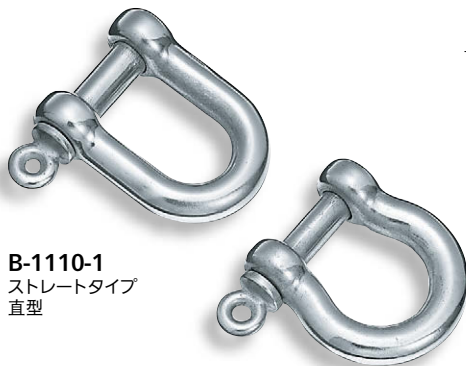
B-1110-1 ストレートタイプ 直型