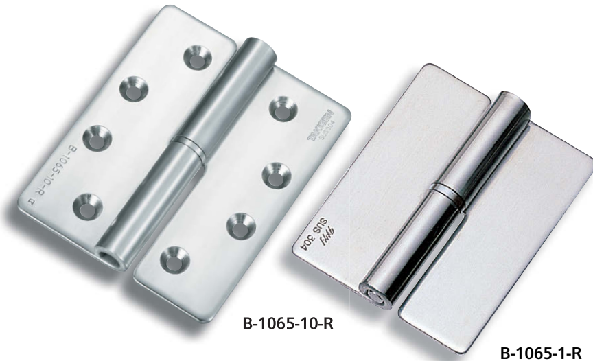
[穴あき 有孔] B-1065-10~14