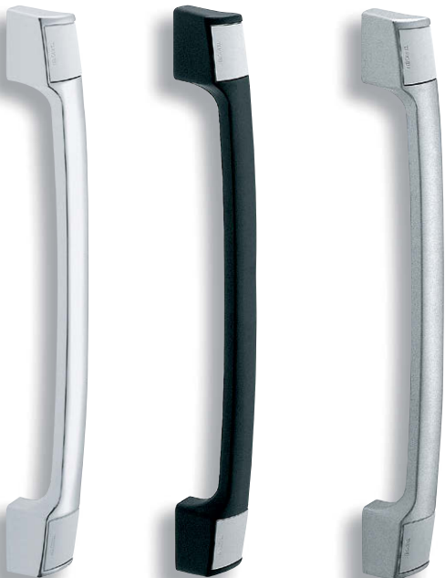
A-41-R-30 クロムめっき 镀铬