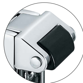
防止锁舌松脱的水平形状。

ハンドル ラッチ式 スナッチ リンク フック式 ロック ハンドル L 型 ハンドル T 型 ハンドル 丸型 小型 押ボタン 取 手 つまみ 止め金 ロッド棒 ジョイント リンク ワイヤ