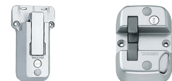
FA-810-C-2 FA-810-C-4 ワンタッチのハンドル受けがございます。 备有单触式手柄扣。

詳細は178～190ページをご参照ください。 详细内容请参阅 178 ～ 190 页。