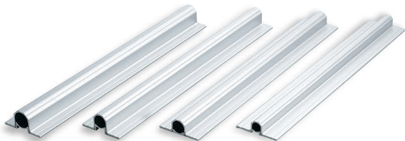
FA-815-G-1 FA-815-G-2 FA-815-G-3 FA-815-G-4